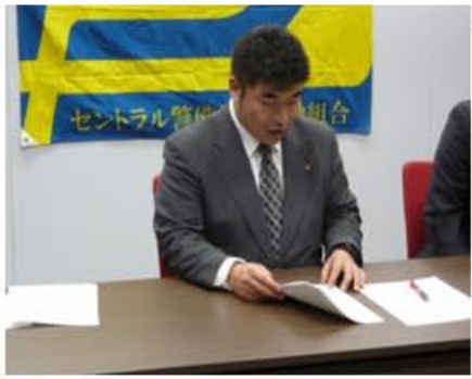
■ 議長を務める一戸副執行委員長