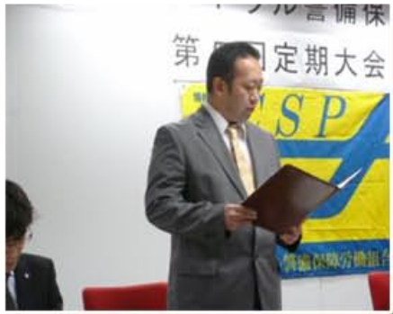
■ 執行委員長の開会の挨拶