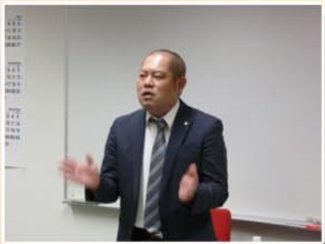
■ セコムジャスティックユニオン永間執行委員長からのご挨拶